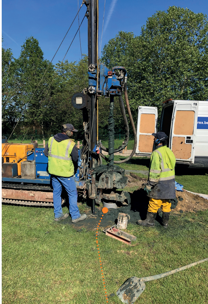
Een onderaannemer voert een grondboring uit.

Een grondboring duurt maximaal een week . Het aantal grondboringen dat wordt uitgevoerd is afhankelijk van het type mast en de samenstelling van de ondergrond.