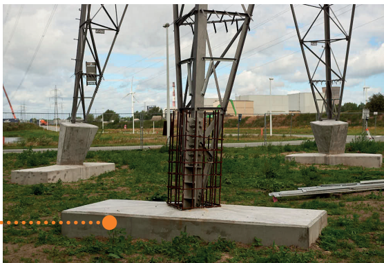
Versterkte fundering van een bestaande mast.

Elia is verantwoordelijk voor het beheer, het onderhoud en de uitbouw van het Belgische hoogspanningsnet en voert in het kader hiervan bodemonderzoeken uit. Dit onderzoek bepaalt welke funderingen nodig zijn om de masten stevig in de grond te verankeren bij de bouw, vervanging of versterking van een bovengrondse luchtlijn.