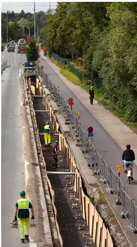
Aanleg ondergrondse kabelverbindingen